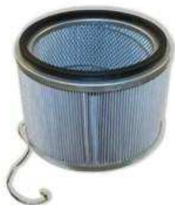
HEPA-Фильтр тонкой очистки