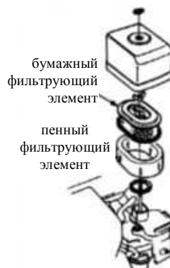
Рисунок 1. Воздушный фильтр