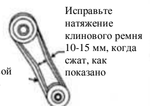
Рисунок 2. Натяжение клинового ремня

ВНИМАНИЕ НИКОГДА не пытайтесь проверить клиновой ремень при работающем двигателе. В случае попадания рук между клиновым ремнем и сцеплением возможны серьезные травмы. Всегда используйте защитные перчатки.