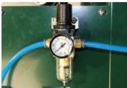
Фильтр влагоотделитель с редуктором