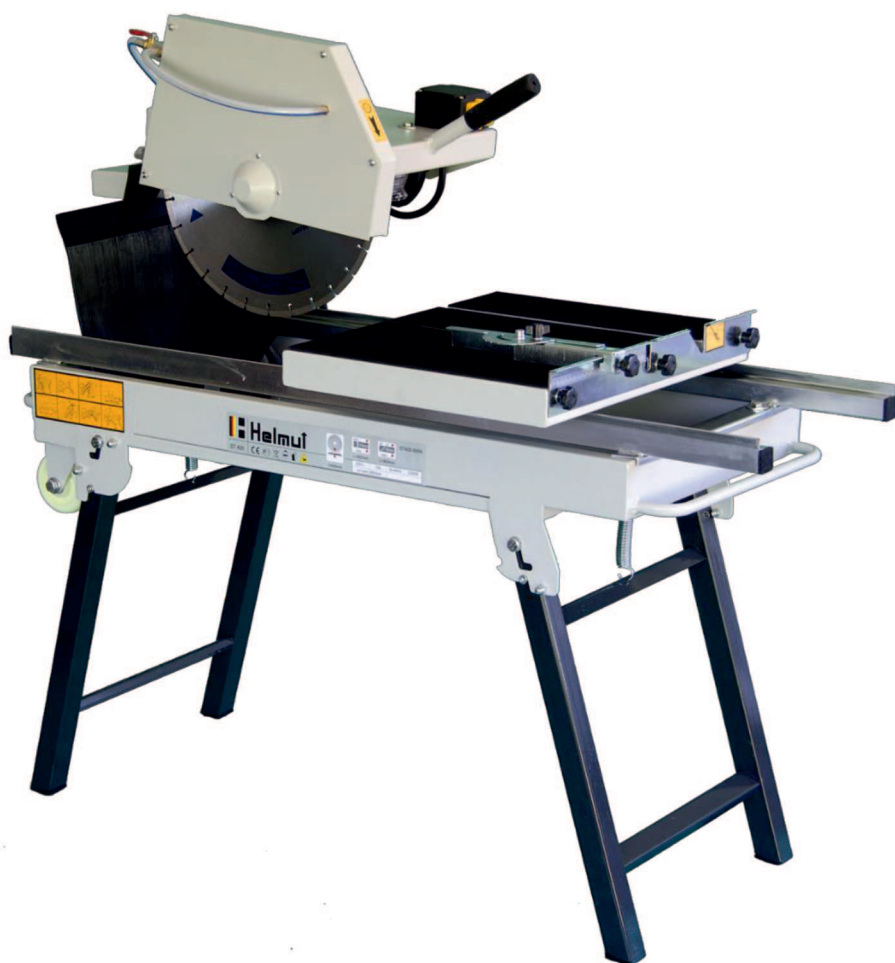
Рисунок 2 – Станок камнерезный серии ST/N

Станки камнерезные серии ST/N включает в себя все необходимое для начала работ. Отличаются от станков ST наличием усиленной рамы, крепких опор, поставляются в 9 различных вариантах с длиной реза 800, 900, 1000мм, а также дисками 350, 400, 450 метров.