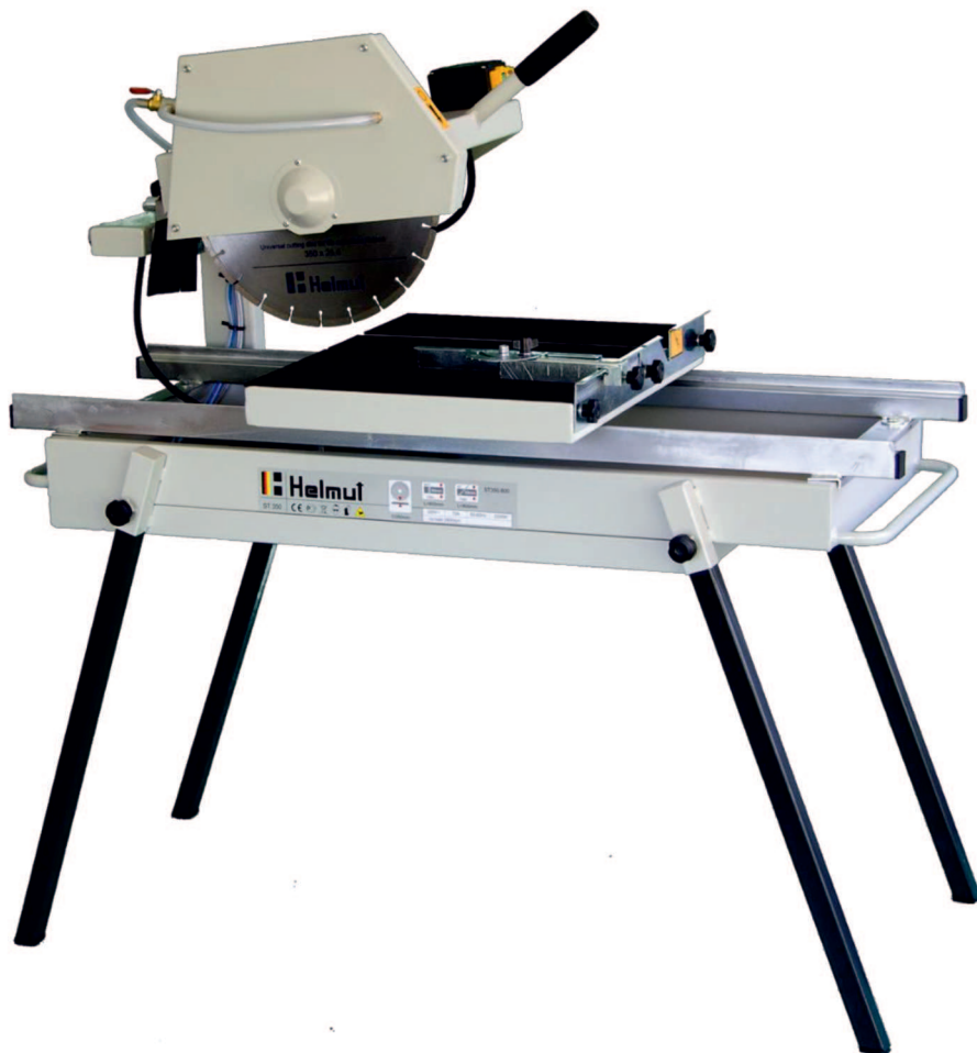
Рисунок 1 – Станок камнерезный серии ST

Станок камнерезный электрический предназначен для резки керамогранитной и тротуарной плитки, кровельной черепицы, гранита, базальта, мрамора, бордюрного и дорожного камня, строительных бетонных и газобетонных блоков.